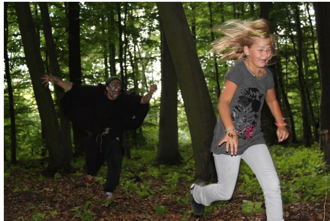
Hannah auf der Flucht vor einem Ork.