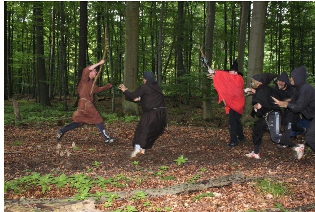
Gindalfs übermütiger Frontalangriff auf Saromans Armee.