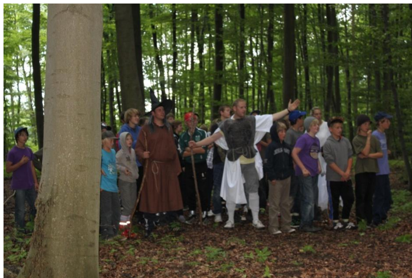
Die kleinen Hobbits trafen angeführt von den Zaubererbrüdern Gandalf und Gindalf in den Wäldern von Ruppertsklamm auf Saroman und seine gefährlichen Orks.